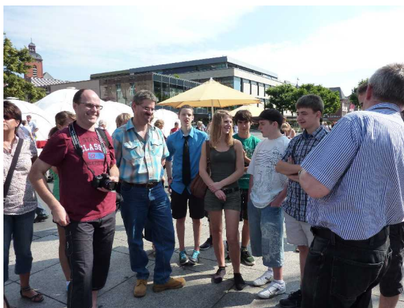
Stadtführung in Mainz

So besannen wir uns auf andere Verbindungen und erhielten vom Akkordeon-Orchester Brotdorf aus dem Saarland eine Zusage. Die saarländischen Freunde reisten am Freitag an und wurden bereits kurz nach ihrer Ankunft mit rheinhessischer Gastfreundschaft in die Straußwirtschaft zum „Leberschorsch“ in Hechtsheim begleitet.