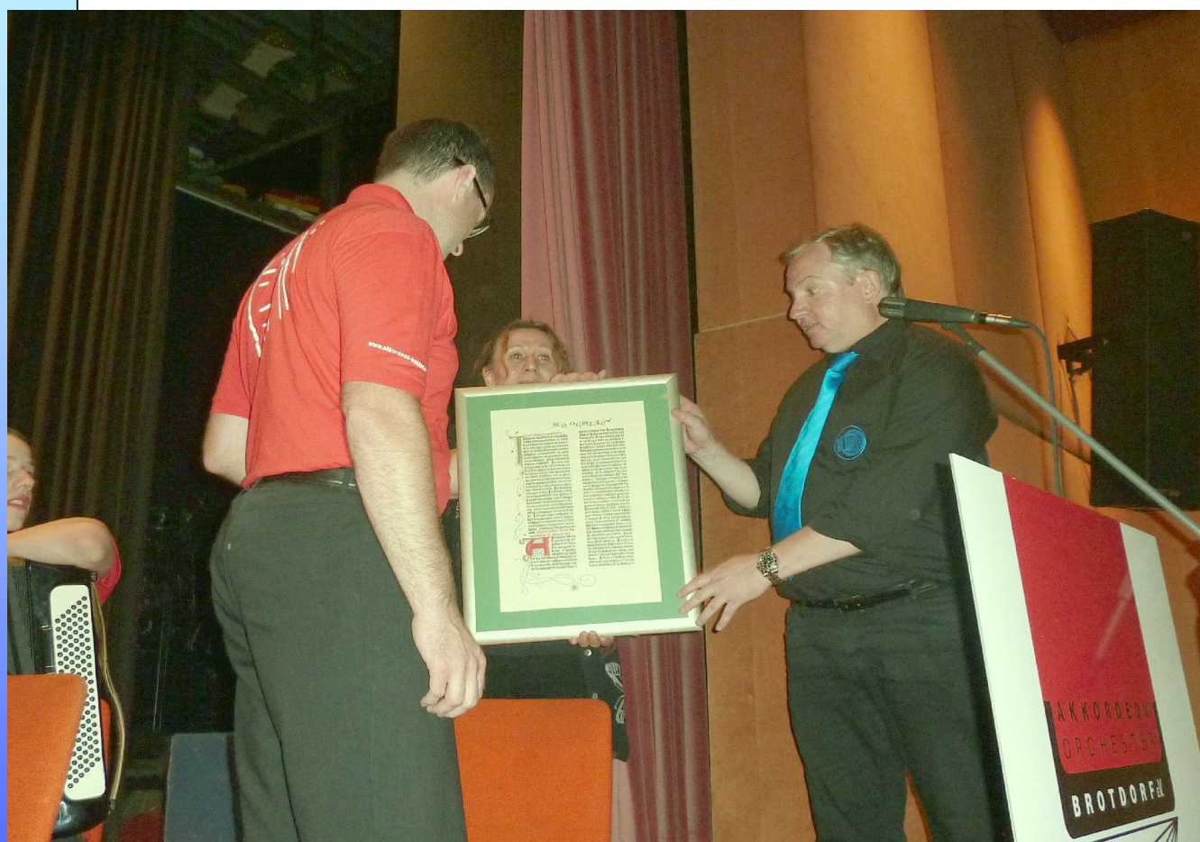
Eine Bibelseite für das Gastorchester aus Brotdorf

Geschäftsstelle: Lahnstraße 27, 55296 Harxheim