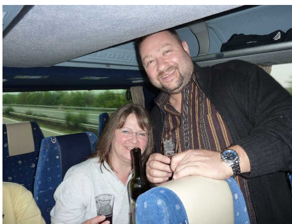
...so macht die Reise doch gleich mehr Spaß

Höhepunkt für unsere Luxemburger Freunde war ein Auftritt im Gasthof der Familie Slavko Avsenik in Begunje während eines Auftritts einer Gruppe der Oberkrainer. Ein zweiter Auftritt der Luxemburger fand am Samstag Abend beim „Okarina Ethnofestival Bled“ im Kurpark am See statt, bei dem ein sehr zahlreiches Publikum das Orchester aus Luxemburg feierte. Die Reise war erlebnisreich und voller neuer Eindrücke aus Bled und Umgebung wurde am Sonntag die lange Heimreise angetreten.