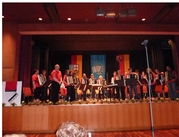
Das Akkordeon-Orchester Brotdorf